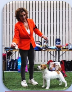
BIS Junior 2023 Suspecial's You Owe Me One SE53586/2022 e. Kaszavölgyi-Fürge Niko u. Suspecial's Fit As A Fiddle uppf. Susann Lothian äg. Uppf. & Helen Thors