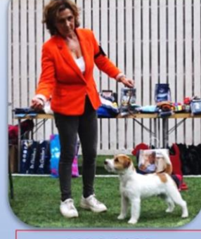
BIS 2 2023 Suspecial's You Owe Me One SE53586/2022 e. Kaszavölgyi-Fürge Niko u. Suspecial's Fit As A Fiddle uppf. Susann Lothian äg. Uppf. & Helen Thors