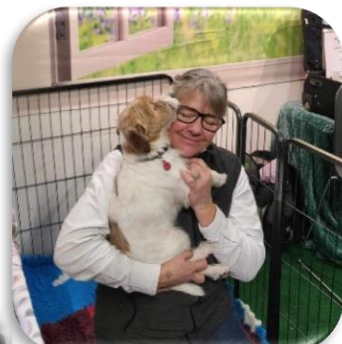
Camilla var i montern på lördagen. Hon satt inte i buren hela tiden.