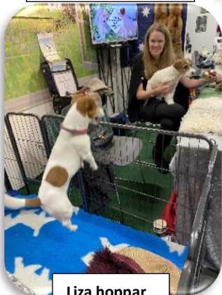
Liza hoppar och studsar