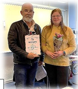
Bästa Gryt av två och Bästa HTM True Fairytale´s Key to Freedom